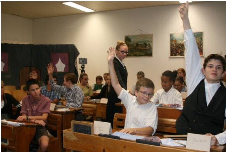
Mit strengem «Bürzi», langem, schwarzen Jupe und Rohrstock in Händen leitet das Fräulein Lehrerin den Nostalgie-Unterricht.

«200 Jahre Bezirksschule» wurde in Bad Zurzach mit Nostalgie und Zukunftsmusik, einer Prise Politik und viel Humor gefeiert.